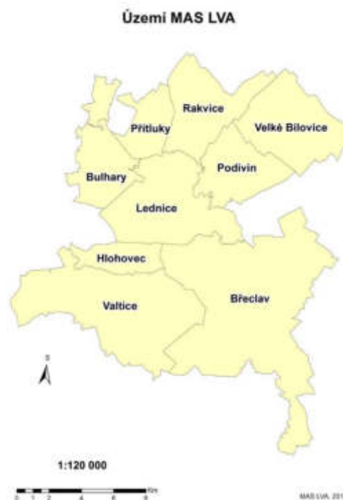
Obr. 1: Území MAS Lednicko-valtický areál

Největším sídlem území je město Břeclav. Historickými turistickými centry jsou obec Lednice a město Valtice, v okolí těchto dvou sídel se rozkládá světoznámý Lednicko-valtický areál zapsaný v seznamu UNESCO. MAS realizuje své aktivity na území devíti měst a obcí Lednicko-valtického areálu, které souhlasily se zařazením svého území do MAS v programovém období 2014–2020.